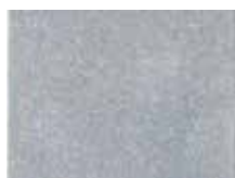
Acier brut non rouillé