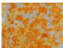
Acier à demi rouillé