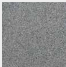
Granit gris foncé