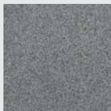
Granit gris foncé