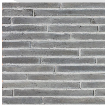
Mura Brick Fuego