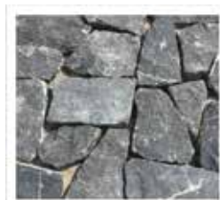
Black limestone mosaic