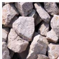
Granit gris rosé