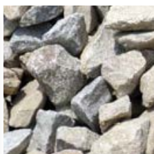
Granit gris mélangé