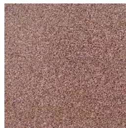
Grès rose des Vosges