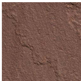
Rouge/brun des Indes