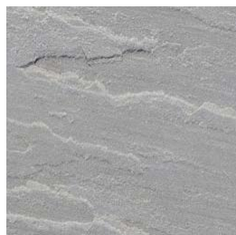
Gris des Indes