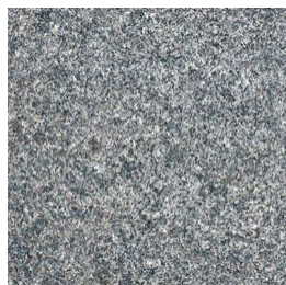
Gris foncé flammé