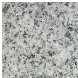
Gris clair flammé